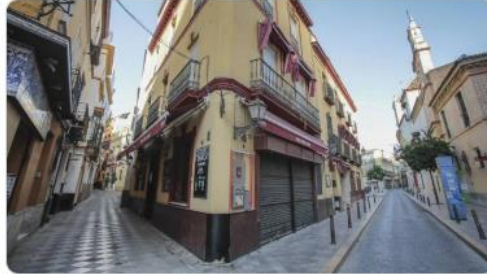
2:56 p. m. · 4 ago. 2020 · Buffer

Fotogalería: Con la llegada del mes de agosto Sevilla se queda vacía y este año, además, la ausencia de turistas y el cierre de negocios por la crisis del coronavirus han acentuado aún más la soledad de sus calles, sobre todo en el centro histórico buff.ly/3kc8tyw