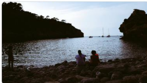
12:39 p. m. · 10 ago. 2020 · Twitter for Android

La debacle económica en sitios como Mallorca es terrible. El 60% de los negocios no abren en todo el verano, hoteles con precios tirados y semivacíos, los africanos haciendo 20 km diarios a pie para vender 3 pares de gafas... 😞 Y calas casi privadas, eso también.